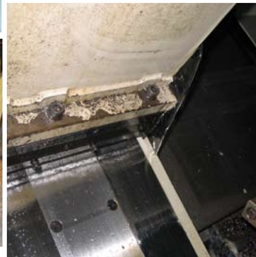
Revolverin öljyvuoto, tiivisteen vaihto ja toimivuuden varmistus.