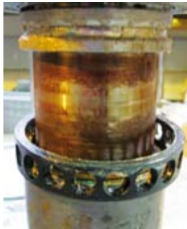
Karan laakerointi; yläkuvassa laakerivaurio, oikealla korjattu kara.