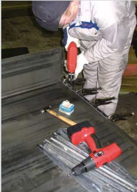
Telahiomakoneen johdesuojien kunnostushuolto.